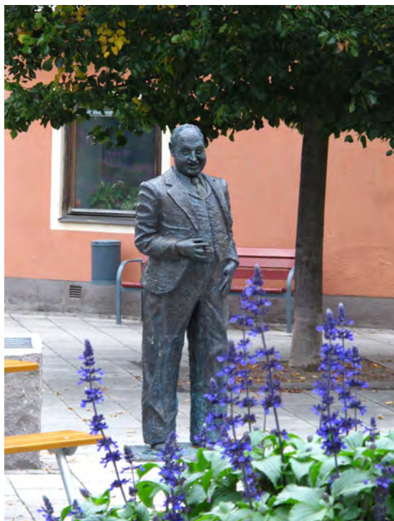
Thor Modéen föddes i Kungärik 22 januari 1898. Skådespelaren och revyartisten spelade in 88 filmer.

Konst- och hantverkssafarin arrangeras varje år en helg i maj. Då kan du på ett 20-tal olika platser, både i tätorten och runt om i de vackra omgivningarna, besöka cirka 50 konstnärer och hantverkare. Under övriga året pågår olika konstutställningar i bibliotekets utställningshall och det finns flera aktiva konstnärer och hantverkare i och runt Kungärik.