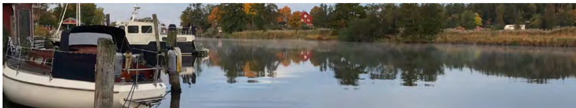
Gästhamnen en oktober morgon.

Kungsörs brukshundklubb driver och sköter hundarenan. Hallen på cirka 1 100 m 2 är uppvärmd och lämpar sig bäst för hundträning. Hallen går också att hyra.